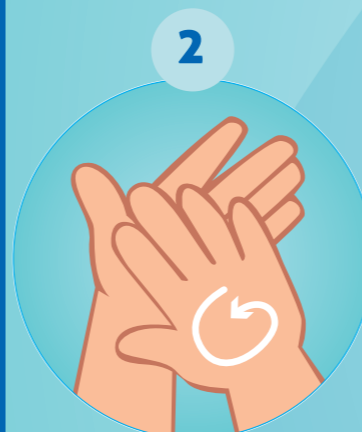
2 PAUME CONTRE PAUME