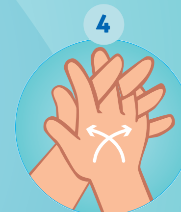
4 PAUME CONTRE PAUME AVEC LES DOIGTS ENTRELACÉS