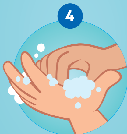
4 SE FROTTER LE BOUT DES DOIGTS, LES DEUX FACES DES MAINS...