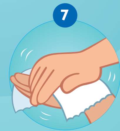
7 SE SÉCHER SOIGNEUSEMENT