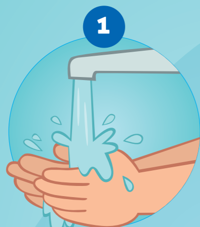
1 SE MOUILLER LES MAINS