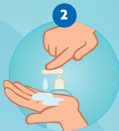
2 PRENDRE DU SAVON