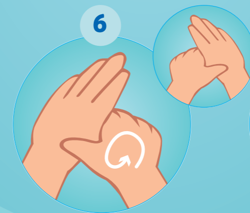
6 LE POUCE DE LA MAIN GAUCHE PAR ROTATION DANS LA PAUME DROITE FERMÉE ET INVERSÉMENT