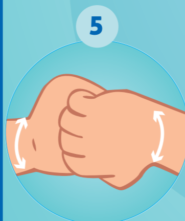
5 LE DOS DES DOIGTS EN LES TENANT DANS LA PAUME DE LA MAIN OPPOSÉE AVEC UN MOUVEMENT D'ALLER RETOUR LATÉRAL