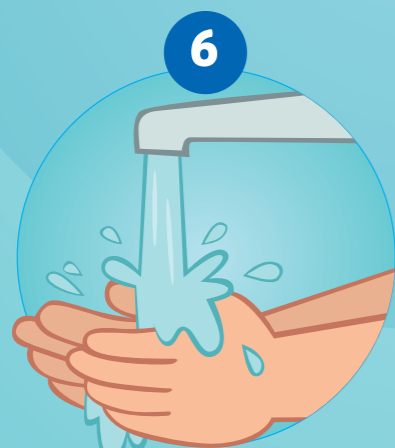
6 SE RINCER LES MAINS