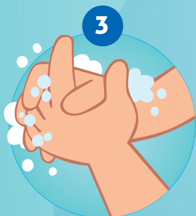
3 SE SAVONNER LES MAINS